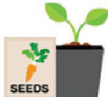
Seeds and plants for food